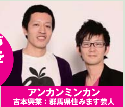
アンカンミンカン 吉本興業：群馬県住みます芸人