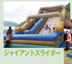
ジャイアントスライダー

アドフェスナイト アドフェスナイトは19:00スタート!夜の会場はキャンドルと熱気球のやさしい灯りで包み込まれます。野外ライブも開催!美味しい屋台も充実!入場無料で夜もハッピー♪